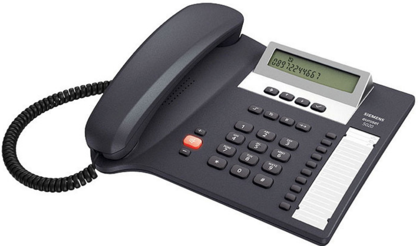
Teléfono Unilínea Analógico