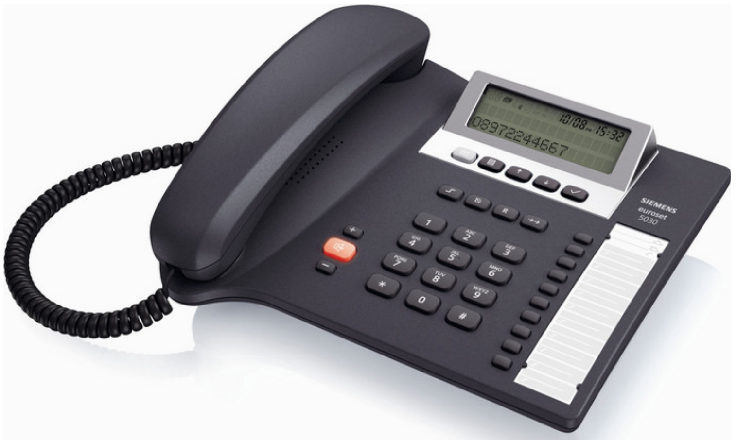
Teléfono Unilínea Analógico