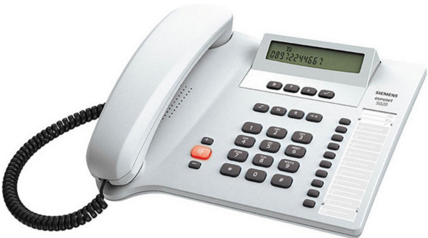
Teléfono Unilínea Analógico