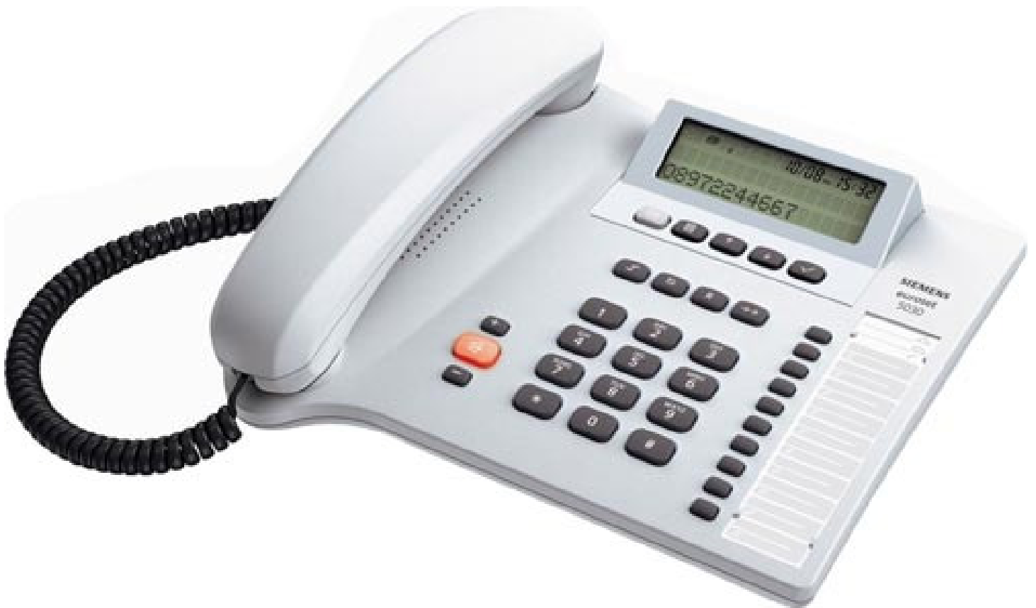
Teléfono Unilínea Analógico